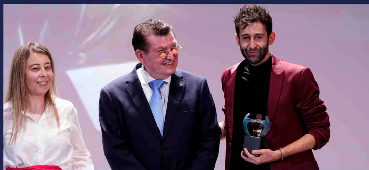
Premio Solidarios 2023. Grupo Social Once

Entre los premios y reconocimientos obtenidos, destacan el PREMIO CREA en los Premios del Teatro Musical con el que fue galardonado por su labor como creador en el Teatro Musical en España. Y el PREMIO SOLIDARIO de Grupo Social Once por su labor inclusiva en las Artes Escénicas.